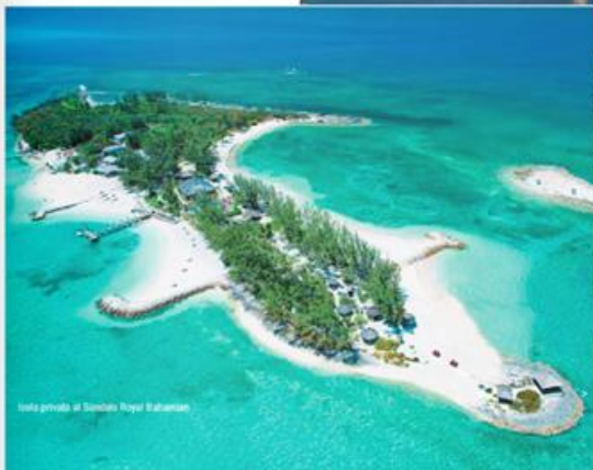
Isola privata al Sandals Royal Bahamian

Costruiamo un viaggio Sandals vacanze a 5 stelle